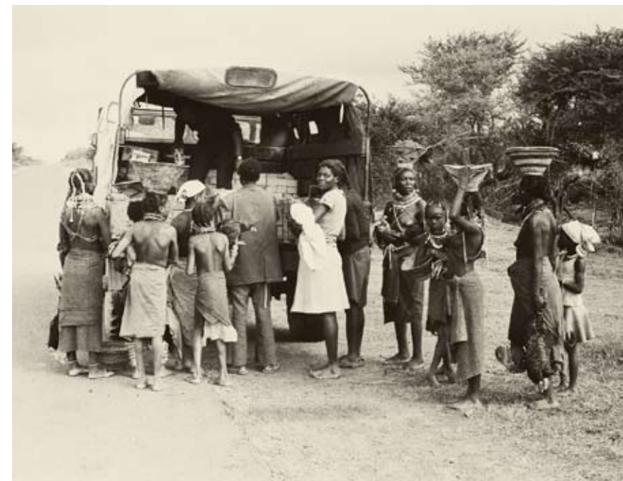
Машина советских военных остановилась для обмена с местными жителями протомваров на сельхозпродукты. Район Мулондо, 1984

– Был. Они оказывали помощь в Эфиопии, Мозамбике и других странах Африки. Есть данные, что в Африке погибло более 2 тыс. кубинских интернационалистов. У них была такая теория: чем больше они свяжут с помощью СССР в разных точках планеты американцам руки, тем дольше те не доберутся до Кубы. Кубинцы стремились поддерживать людей, объявивших, что у них такие же идеалы: освобождение от колониальной зависимости, построение в перспективе свободного от эксплуатации общества.