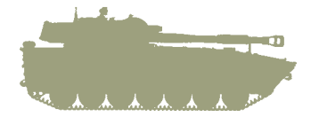
Самоходная гаубица «Гвоздика»

ния в Анголе с перевесом примерно в 10% – все-таки за МПЛА.