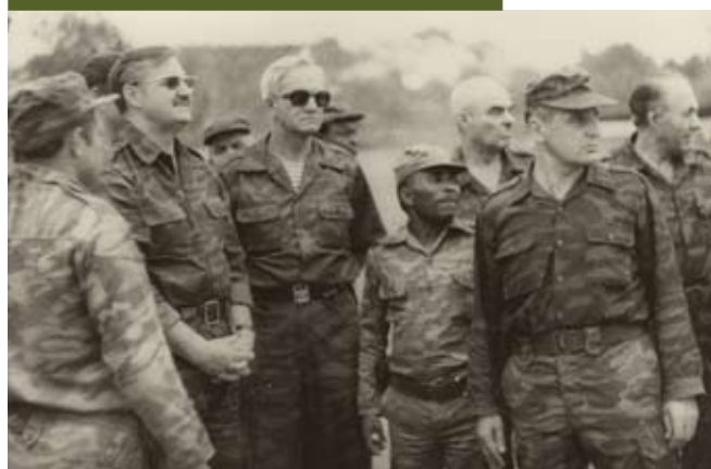
Военная делегация СССР во главе с генералом армии В. И. Варенниковым во время выезда в район боевых действий. Ангола, 1985

У нас люди в погонах не могут заниматься бизнесом. В Анголе это официально разрешено