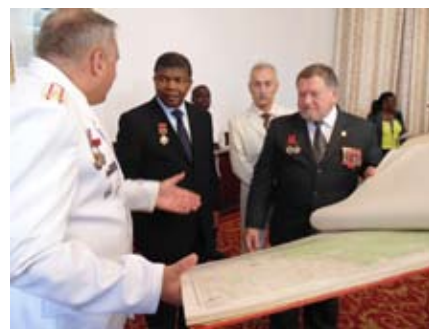
Делегация Союза ветеранов Анголы передает в дар ангольскому министру обороны Жоау Лоуренсу альбом с архивными картами для военного музея. Луанда, 2014

АНК (Африканский национальный конгресс, англ. African National Congress) – политическая организация африканского населения ЮАР. Основана в 1912 году, в 1960–1990 годы – на нелегальном положении. Преследовала цель ликвидировать режим апартеида, осуществить демократические преобразования. С 1960-х АНК поддерживался Советским Союзом. В вузах и техникумах СССР учились сотни его активистов. В советских военных училищах и в лагерях в Анголе под руководством советских инструкторов получали подготовку свыше 2 тыс. бойцов военного крыла АНК «Умконто ве сизве», которому поставлялось советское оружие. Бойцы организации проходили обучение в СССР в 165-м учебном центре по подготовке иностранных военнослужащих.