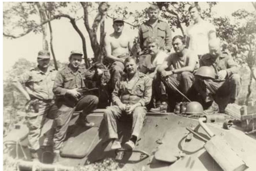
◀ Советские советники на броне БТР перед выходом на боевую операцию. Лузна, Восточный фронт, 1989

СВАПО – Народная организация Юго-Западной Африки (англ. South-West Africa's Peoples Organization, SWAPO) – левая организация населения Юго-Западной Африки, в основном состояла из племени овамбо. В 1960–1980 годы СВАПО вела партизанскую войну против войск ЮАР, занимавших территорию Намибии.