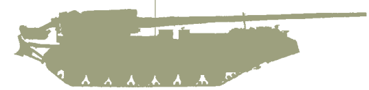
Самоходная пушка «Пион»