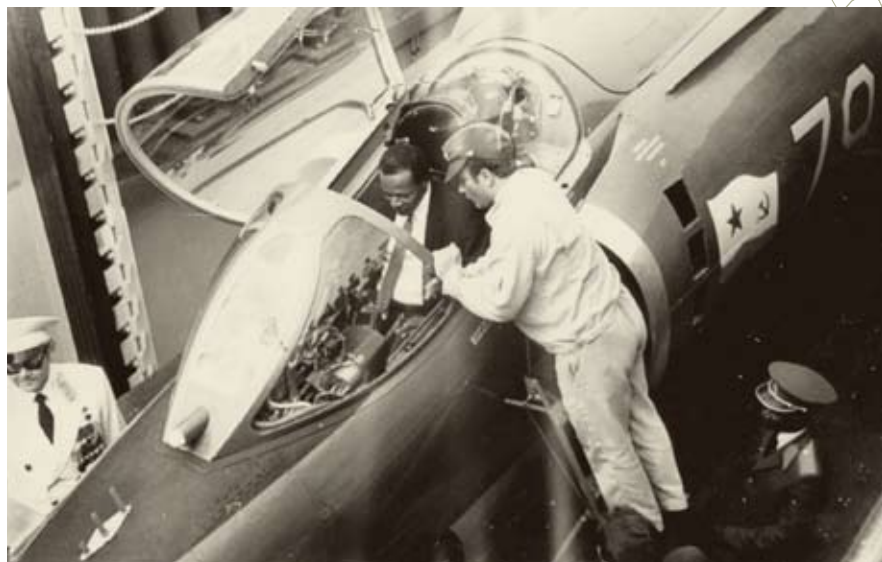
« Президент Анголы Ж. Э. душ Сантуш осматривает кабину истребителя Як-38 на палубе тяжелого авианесущего крейсера «Новороссийск», зашедшего в Луанду с дружеским визитом. Луанда, 1983